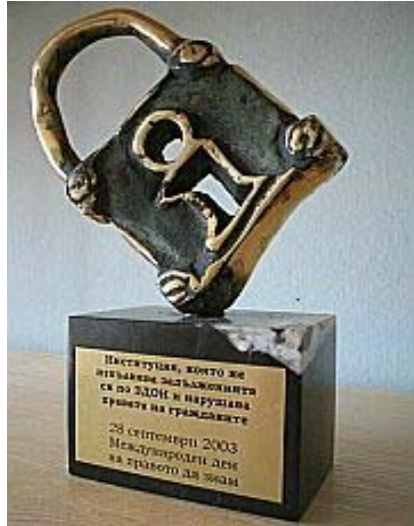
ბულგარეთის ინფორმაციის ხელმისაწვდომობის პროგრამის (AIP) მიერ დანესებული ჯილდო ყველაზე დახურული საჯარო დანესებულებისათვის